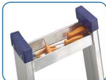
Vaschetta portattrezzi cm 26x7x3