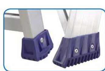
Piedini ergonomici maggiorati antiscivolo rivettati