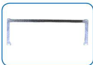
Profilo a C dei montanti