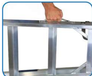
Maniglia di trasporto