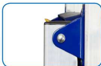
Cerniera in acciaio verniciato