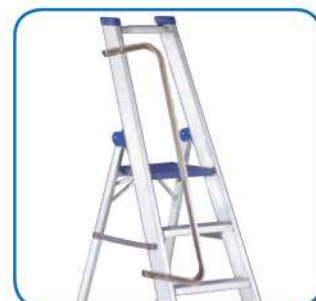
Corrimano a richiesta