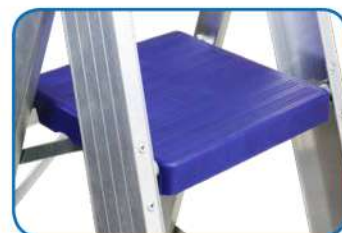
Piattaforma in polipropilene rinforzato (cm 25,5x30)