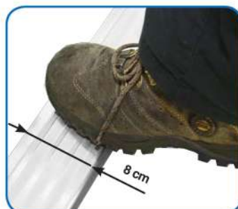
Gradino largo antiscivolo cm 8