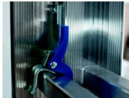
Dispositivo di blocco tronchi ( antisfilo ) Elements block device (unthreading)

Wheels at the top of the 2nd or 3rd element to facilitate sliding along walls (all models)