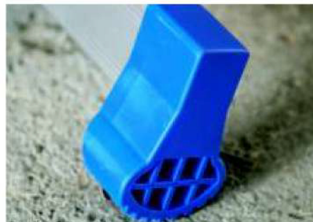
Base stabilizzatrice con tacchi maggiorati The stabilizer base has extra-large feet,