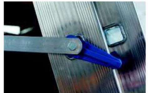
Aste antichiusura in alluminio Element blocking (anti-cloosening) device in aluminium