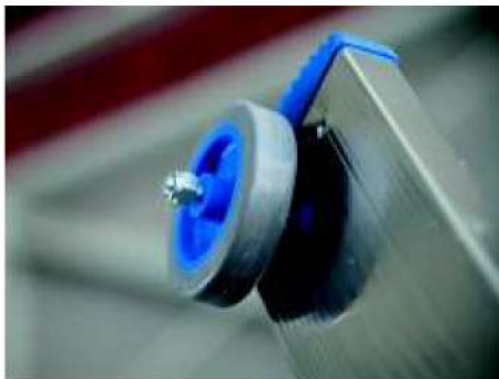
Ruote alla sommità del 2° o 3° tronco per facilitare lo scorrimento a parete su tutti i modelli

Wheels at the top of the 2nd or 3rd element to facilitate sliding along walls (all models)