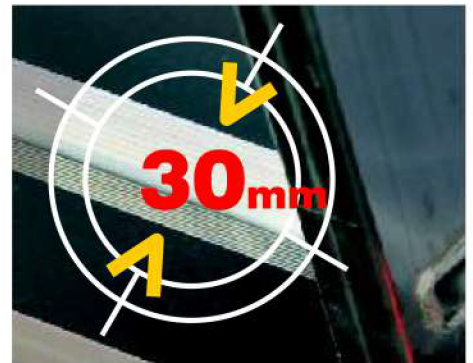
Piolo in alluminio estruso mm 30x30 antisdrucchiolo , con angoli arrotondati 30x30 mm extruded aluminum anti-slip rung with rounded corners