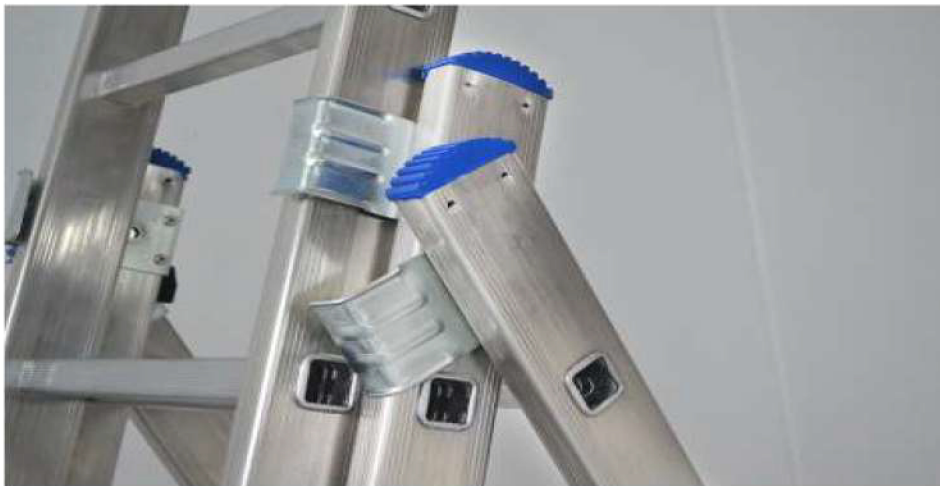
Cerniera antirottura in acciaio, a posizionamento assistito (in caso di urto non si rompe) Unbreakable steel hinge, with assisted positioning (in case of impact does not break)

Azzurra is the TOP series of ladders transformable in 2-3 elements. The automatic reflagging system secures the rungs to the uprights, for long-term prevention of rotation and loosening, even after prolonged intensive use. The aluminum electro welded allows to have a ladder resistant and lightweight at the same time. It can be used extended and double. The distance between the rung is 280 mm. Optional accessories to the ladder allow you to work in the presence of poles and / or gutters and uneven surfaces. Shrink wrap film packaging.