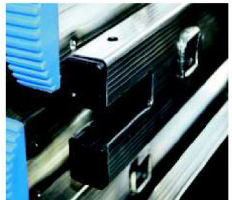
Agevolatore inserimento base stabilizzatrice Facilitator for insert stabilizer base