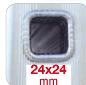
Piolo quadro 24x24 mm