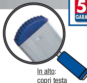
In alto: copri testa

Di dimensioni contenute è particolarmente leggera maneggevole e molto rigida per le leghe usate. Ideale per uso intensivo industriale ed agricolo.