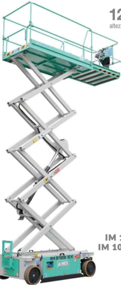
IM 8122 IM 8122 EX