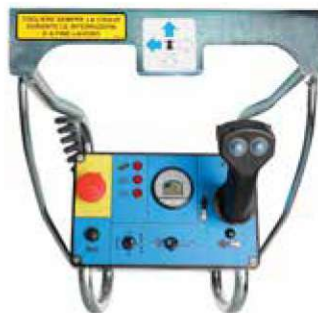
Quadro comandi sulla piattaforma semplice e intuitivo