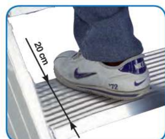
FENICE MAXI profondità gradino cm 20