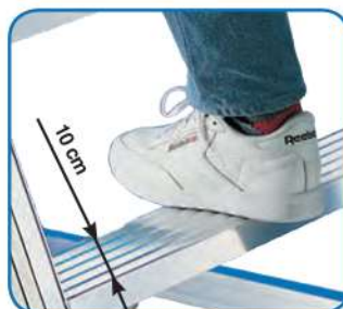
FENICE profondità gradino cm 10

Scale semplici d'appoggio a gradini saldati ai montanti, ad un tronco di salita. In alluminio nervato estruso, permettono di accedere comodamente a sopralci, muri, sottotetti, solai, ecc. Fenice Maxi è a salita comoda con inclinazione rampa a 55°.