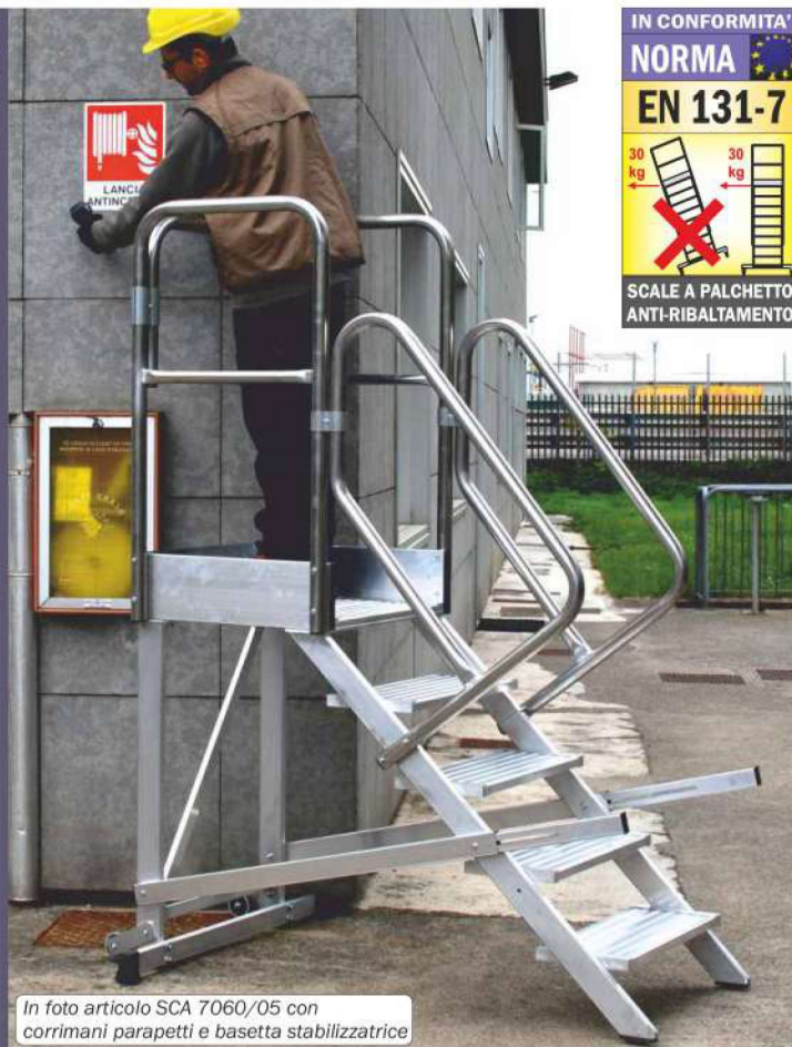
In foto articolo SCA 7060/05 con corrimani parapetti e basetta stabilizzatrice

Corrimano laterale dotato di mancorrente alto mt. 1,10 e corrente intermedio realizzato in robusto profilo tondo Ø 42 mm. in conformità a norme europee EN131.