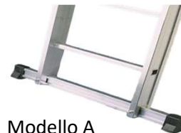
Modello A Allargatori di base