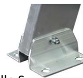
Modello S Piastre di fissaggio a