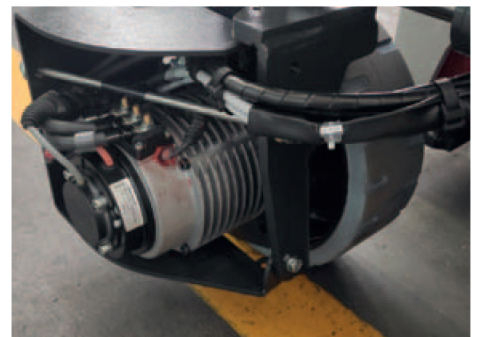
Motore elettrico AC. Sterzo idraulico a 90°