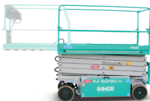
Estensione manuale piattaforma 1,3 m.