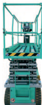
Nuovo design della PLE, della struttura forbice e del cancello di ingresso autobloccante.