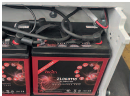
Vano batterie AGM