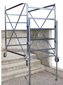
POK ELSCS ST Utilizzo ponteggio su dislivelli

Le misure riportate in tabella sono indicate con le lettere dell'alfabeto