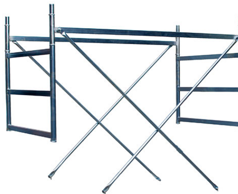
POR 1/2 CAM Mezza campata completa