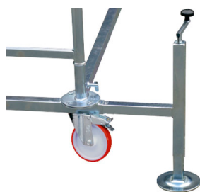
POR STAB V Stabilizzatori/livellatori a vite