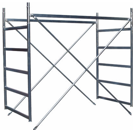
POR CAMPATA Campata intermedia completa