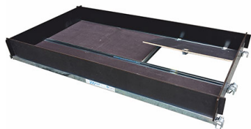
Piano da lavoro in legno completo + fermapiède