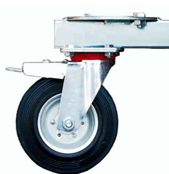
Ruota Ø 100mm