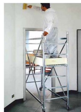
Passaggio attraverso porta