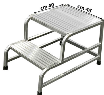
SGA a 2 gradini con piattaforma maggiorata