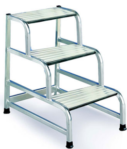
SGA 3 gr standard