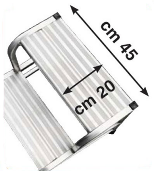
Gradino antisdrucchiolo 45x20 cm