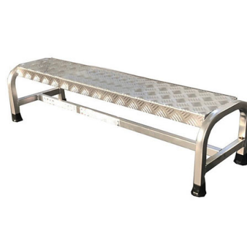
Misure speciali su richiesta