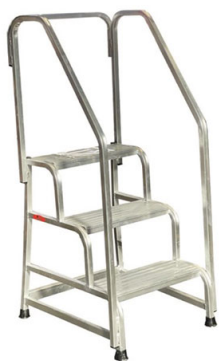
SGA a 3 gradini con corrimani + parapetto