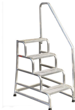
SGA a 4 gr con solo corrimano