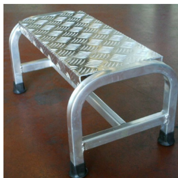
SGA 1 gr standard