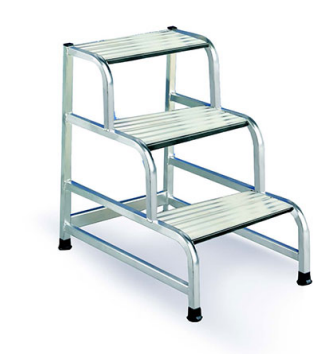
SGA 3 gr standard