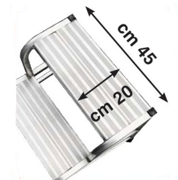
Gradino antisdrucciolo 45x20 cm