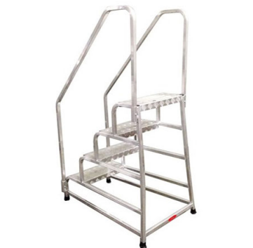
Sgabello con corrimani