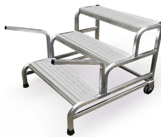
Kit maniglie + rotelle