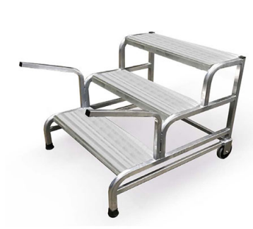
Kit maniglie + rotelle