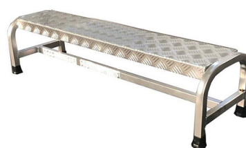
Misure speciali su richiesta