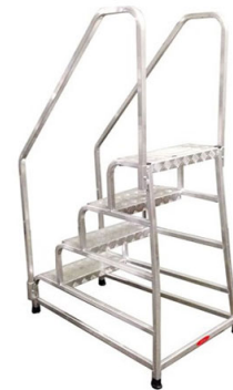
Sgabello con corrimani