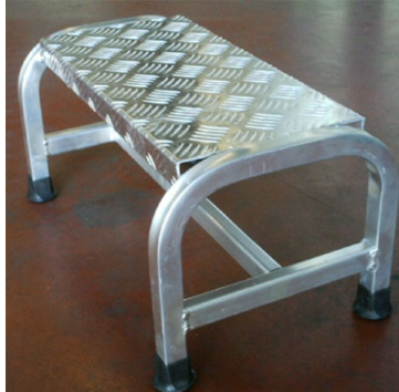
SGA 1 gr standard