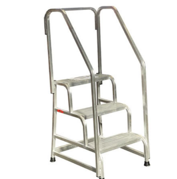
SGA a 3 gradini con corrimani + parapetto