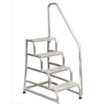
SGA a 4 gr con solo corrimano