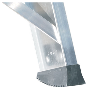
Piedini maggiorati con superficie anti-sdrucchiolo