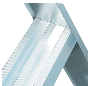
Gradino antiscivolo profondo 83 mm