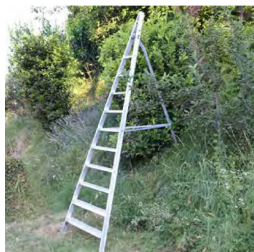
Scala per agricoltura