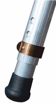
staffe stabilizzatrici regolabili ad estensione telescopica con bloccaggio automatico