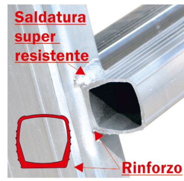
saldatura super resistente