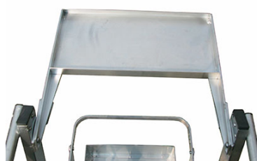
ampio vano porta oggetti