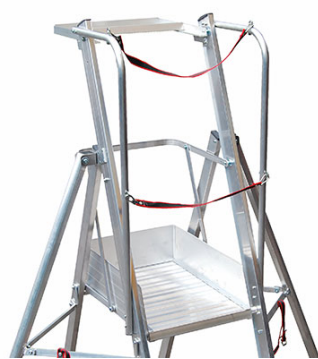
grande piattaforma ed ampia vaschetta portaoggetti cm 22x45