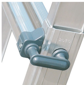
ganci per arresto tronchii