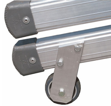
comode ruote di 125 mm per lo spostamento a carriola