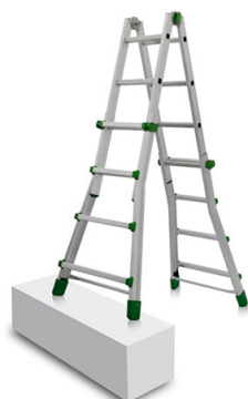
Utilizzabile anche zoppa

Possibilità di sbloccare la scala quando la cerniera è posizionata nella doppia freccia e bloccarla quando è posizionata nella lettera B