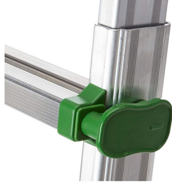
Gancio per bloccare la scala