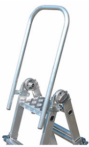
Piattaforma di riposto con parapetto