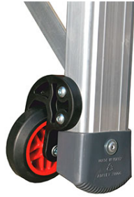
ruote per lo spostamento