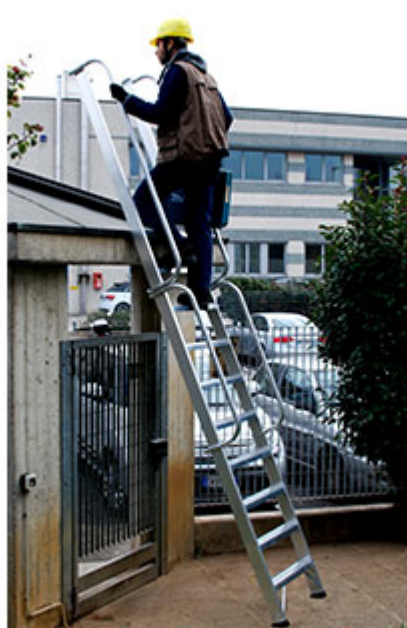
6078 con corrimani