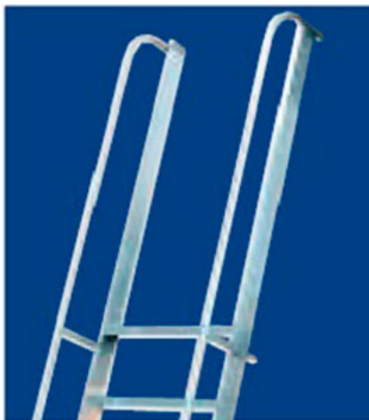
6078 uscita frontale

le misure riportate in tabella sono indicate con le lettere dell'alfabeto