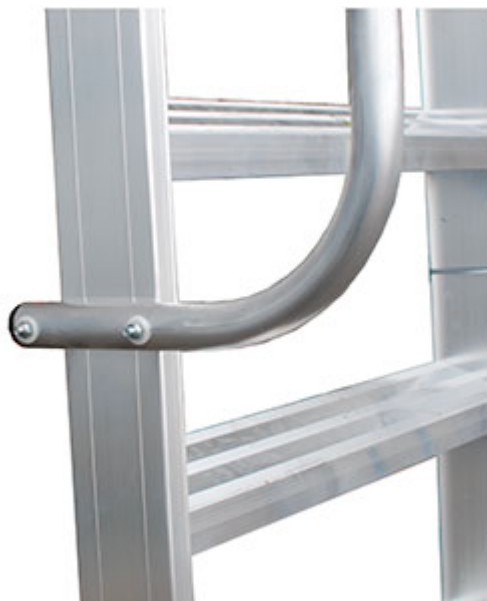
Corrimano realizzato in tubo tondo diam. 30 mm