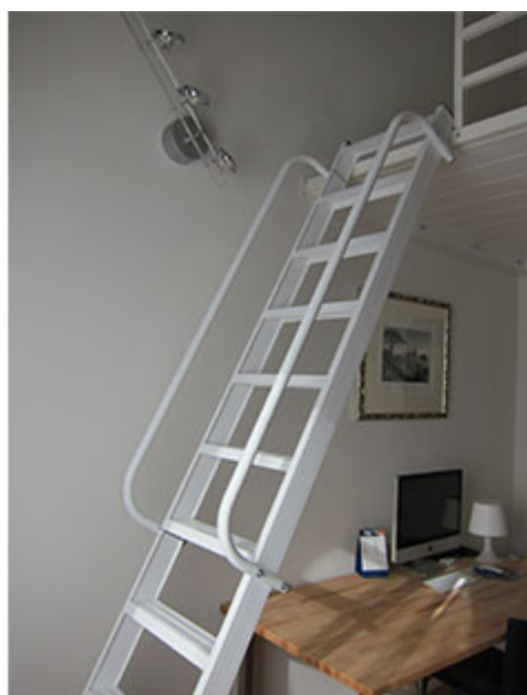
A richiesta scala verniciata