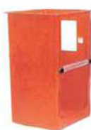
Piattaforma standard in vetroresina