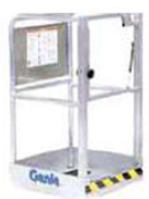
Piattaforma standard con cancello