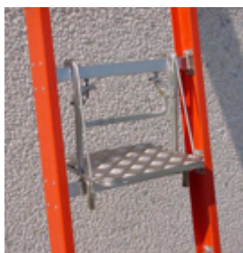
Pedana di stazionamento W-VAL01

le misure riportate in tabella sono indicate con le lettere dell'alfabeto