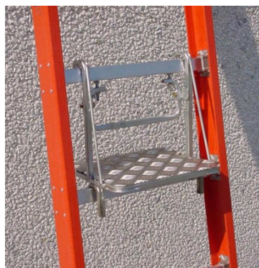
Pedana di stazionamento W-VAL01