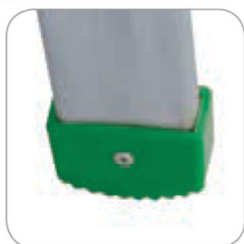
calzare alto 5 cm per PM 205/S - PM 265/S PM 295/S