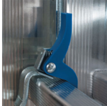
Dispositivo di blocco trochi