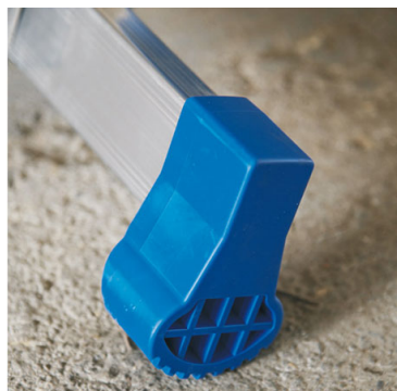
Base stabilizzatrice con tacchi maggiorati