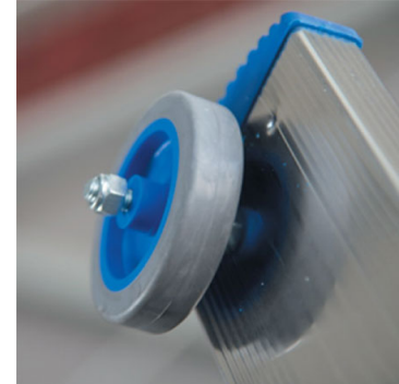
Ruote per facilitare scorrimento alla parete