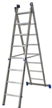
Azzurra a due tronchi