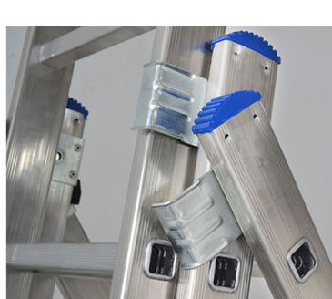
Cerniere anti-rottura in acciaio