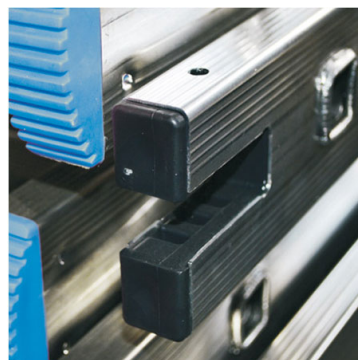
Agevolatore per inserire base stabilizzatrice