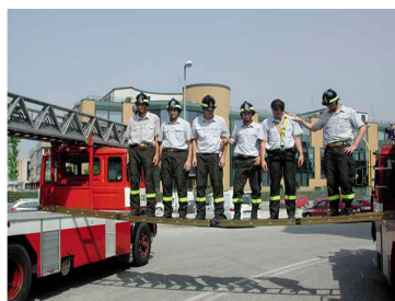
VF prove solidità