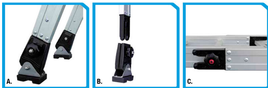
A Particolare scarpetta snodata B Innesto scarpetta C Particolare volantino innesti elementi

le misure riportate in tabella sono indicate con le lettere dell'alfabeto