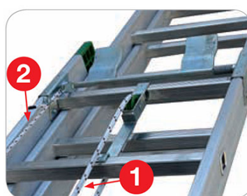
Speciale meccanismo a bilanciere d'acciaio 1 Fune di tiro/trascinamento 2 Fune secondaria di richiamo del bilanciere