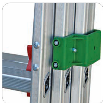
Bracciali scorrimento scala prima