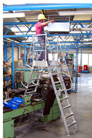
6088/08 con piastre