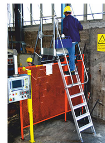
6088/08 con piastre per