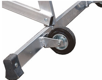
basetta autofrenante con ruote