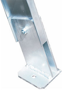
piastre di fissaggio