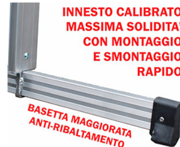
basetta maggiorata antiribaltamento