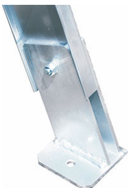
piastre di fissaggio

le misure riportate in tabella sono indicate con le lettere dell'alfabeto