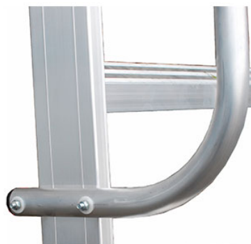
Corrimano in alluminio in tubo tondo 30 mm