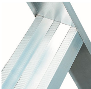
gradino profondo 83 mm