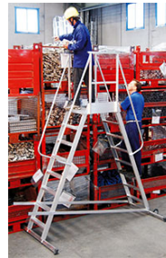
6088/08 con bassetta