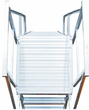
ampia piattaforma 60x75