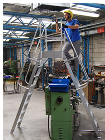
6088/08 con fissaggio a