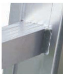
pioli passanti ribordati e fissati con saldatura supplementare