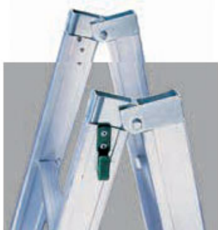
cerniere in acciaio