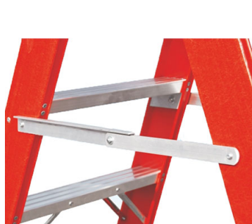
Barre stabilizzatrici di sicurezza anti-chiusura