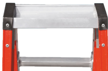
Vaschetta porta-oggetti 9x34