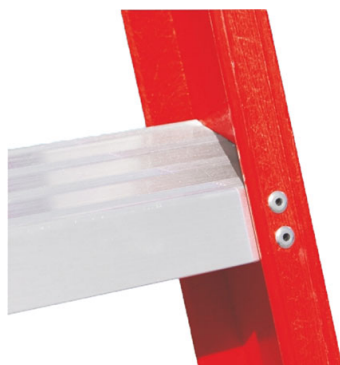
Gradino largo 90 mm