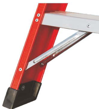
Base rinforzata con nervature anti-urto