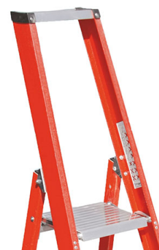
Piattaforma 290 x 260