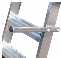
N°2 maniglie d'alluminio per sollevare la scala con le mani

le misure riportate in tabella sono indicate con le lettere dell'alfabeto