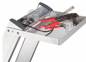
Grande ripiano porta-attrezzi molto robusto con portata di 10 kg.