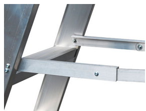
N°2 barre automatiche anti-chiusura