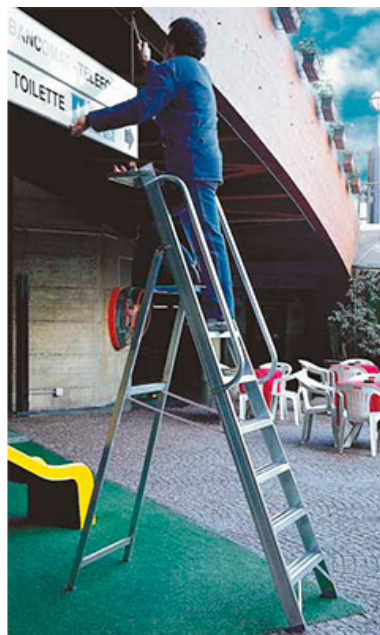
6026 T con corrimani a 7 gradini