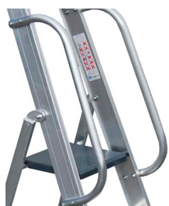
Doppio corrimano di alluminio in tubo tondo Ø 30 mm.