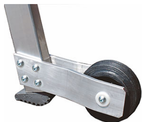
N°2 ruote Ø 100 mm. su staffe in alluminio