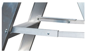
N°2 barre anti-chiusura per kit carriola