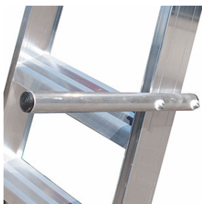
N°2 maniglie per sollevare la scala

le misure riportate in tabella sono indicate con le lettere dell'alfabeto