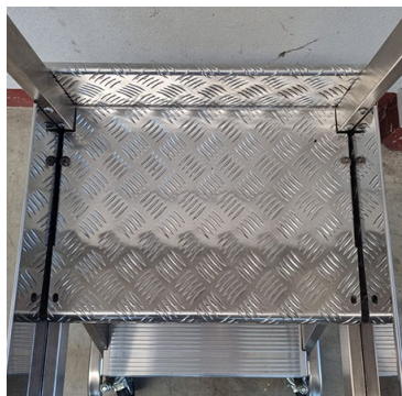
Pianerottolo 450x340 mm