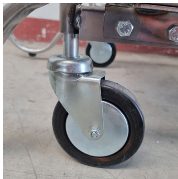
Ruota anteriore piroettante Ø 100 mm