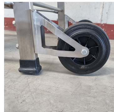
ruote posteriore fissa Ø 140 mm