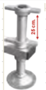
livellatore a vite

gradino profondo 20 cm garantisce la massima comodità del piede