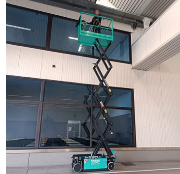
IM 5980 AC