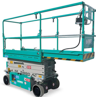
Prolunga 1,00 mt