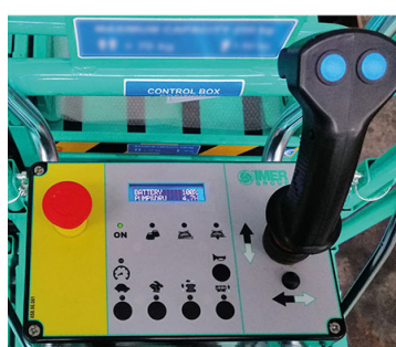
Pannello di controllo in piattaforma