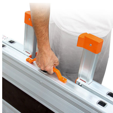
Apposita maniglia per il trasporto