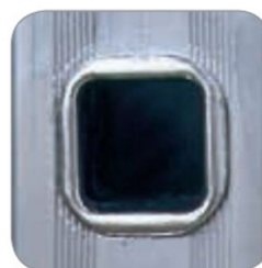
Pioli 30 x 30 mm