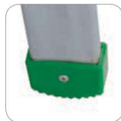
calzare alto 5 cm per PM 205/S - PM 265/S PM 295/S

Pioli a rombo inclinati 68° ATTENZIONE!! NON PIÙ SPIGOLI SOTTO I PIEDI, LE GAMBE NON SI AFFATICANO! Progetto e brevetto FACAL (Patent)