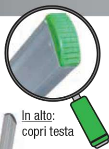
In alto: copri testa

La scala porta di serie, sotto i calzari, i fori per l'applicazione eventuale di piedi snodati.